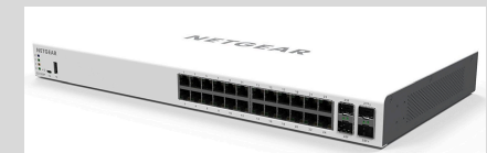
GC728XP Smart Switch basado en la nube Insight Managed con 24 puertos Gigabit Ethernet PoE+, 2 puertos SFP y 2 puertos SFP+ 10G de fibra