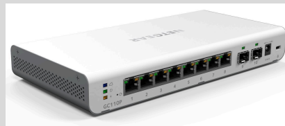
GC110P Smart Switch basado en la nube Insight Managed con 8 puertos Gigabit Ethernet PoE y 2 puertos de fibra SFP