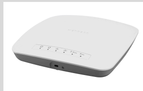
WAC510 Punto de Acceso AC Wave 2 w/router mode