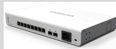
GC510PP Smart Switch basado en la nube Insight Managed con 8 puertos Gigabit Ethernet PoE+ de alta potencia y 2 puertos de fibra SFP