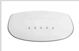
WAC505 Punto de Acceso AC Wave 2